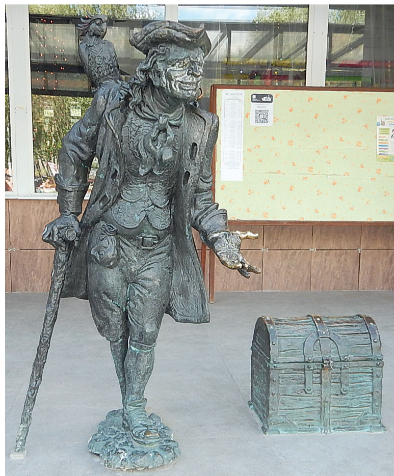
Интересно, если пирату потерять палец, то будет что?

он квадратных метров. Значит речь идет о примерно, двух миллиардах рублей в год. И откуда управляшки возьмут такие деньги?! Ввести в штат еще одного дворника они не имеют права. Царапнуть денег с эксплуатации и ремонта жилых домов, тоже не могут. Остается только потихоньку не добавлять услуги, например, по уборке подъездов или еще чего-то не сделать в доме. Я понимаю, что такие законы (Постановления, Решения) работать не будут. И УК будут саботировать работы по содержанию этих террито-