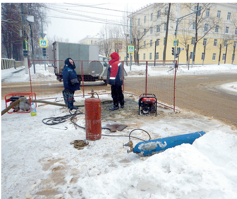
Первомайская, д. 9. 22 февраля, 2021 г.

кум, ОВД, стадион «САЛЮТ», Дом пионеров и многие другие учреждения пострадали так же. На улице было примерно 20 градусов мороза. Всего отключенными от тепла оказались около 100 домов с проживающими в них порядка 15 000 жителей.