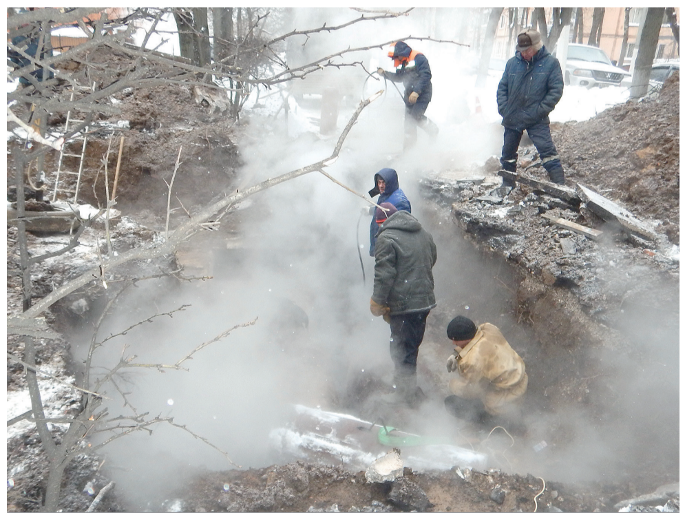
Циолковского, д. 6. 16 февраля 2021 г.