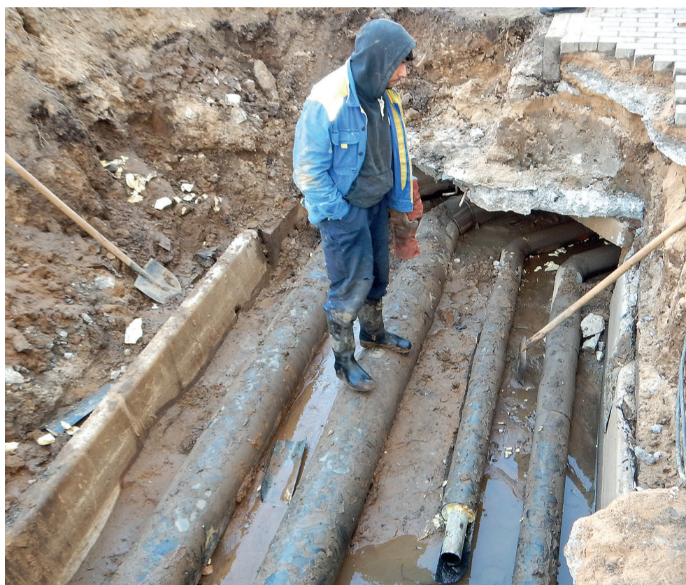
Новый бульвар, д. 1. 24 марта 2021 г.

утра. И еще в течение двух дней во многих подъездах наблюдались проблемы с отоплением, так как стояки оказались завоздушенными и слесари управляющих компаний просто не успевали реагировать на просьбы жителей.