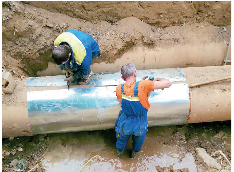
Циолковского, д. 4. Сентябрь, 2020 г.

В начале сентября прошлого года произошла авария теплотрассы напротив дома № 4 по улице Циолковского. Тогда с аварией справились за пару дней, заварив трубу и, видимо, для убедительности поставили оцинкованный лист металла на саморезы. В этом году, 16 февраля, прорвало эту же трубу, в ста метрах от сентябрьской аварии, напротив первого подъезда дома № 6 по улице Циолковского. При этом МУП «Инженерные сети» почему-то объявило местом аварии площадь Собина д. 1. Это адрес ДК «ВПЕРЕД». В этот раз все было намного серьезней. Дома на улицах Первомайская, Циолковского, Октябрьская, Маяковского, Павлова, Советская, Дирижабельная, Ак. Лаврентьева, Комсомольская, Институтский переулочек остались без отопления. Соответственно, все школы, детские сады, техни-